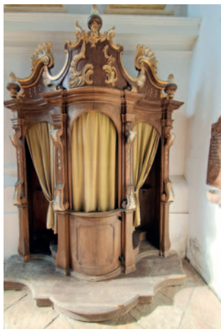
Text und Bild: Irmi Huber

Die Gestalter der einzelnen Szenen geben am Ende der Fastengottesdienste kurze Hinweise zu ihrer Umsetzung der biblischen Botschaft. Die Kirche ist zu den Gottesdienstzeiten ganz geöffnet. Herzliche Einladung!